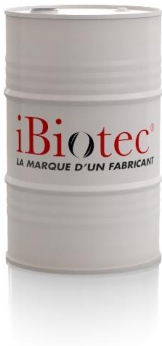
Tong 200 L